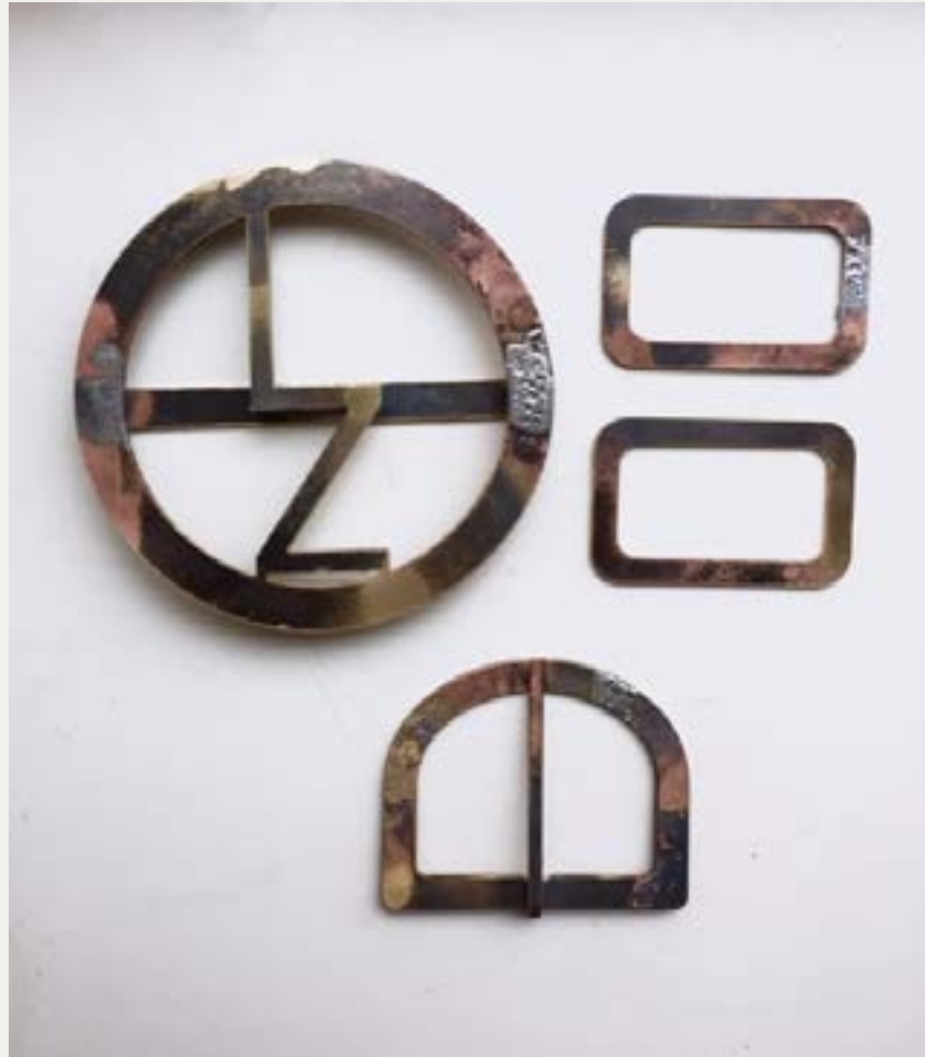
Gesp gemaakt met de water snijder